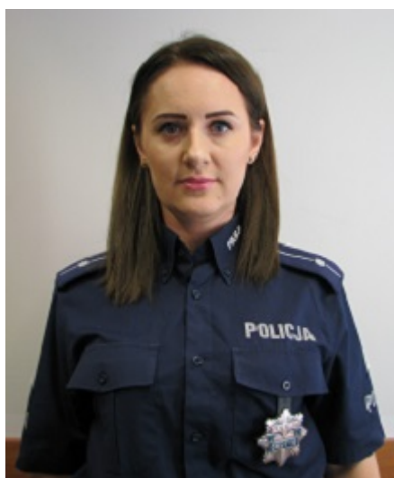
Dzielnica nr 31