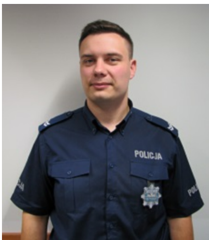
Dzielnica nr 27