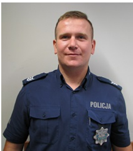
Dzielnica nr 36