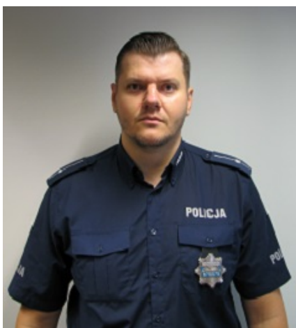
Dzielnica nr 29