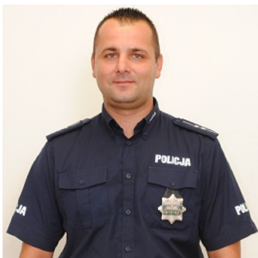
Dzielnica nr 98