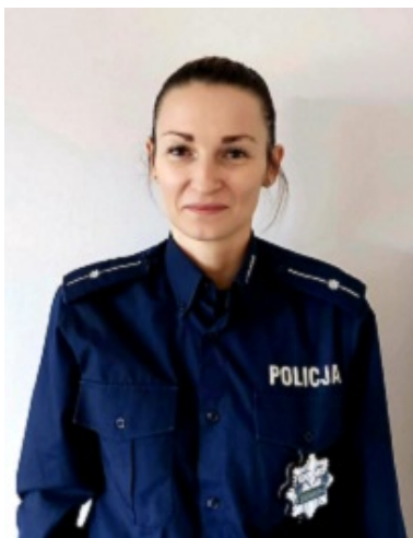
Dzielnica nr 97

e - mail: sebastian.lewandowski@bg.policja.gov.pl