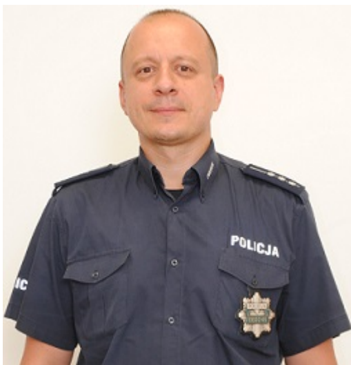
Dzielnica nr 99