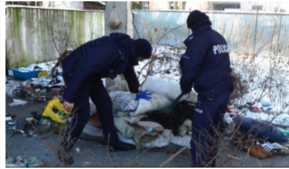
policjanci kontrolują miejsca przebywania osób bezdomnych #2