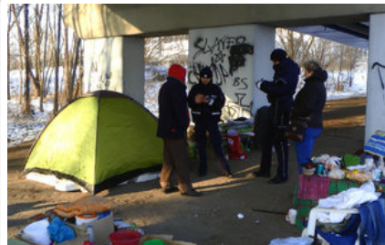
policjanci kontrolują miejsca przebywania osób bezdomnych #5