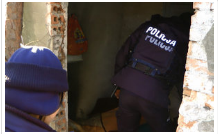
policjanci kontrolują miejsca przebywania osób bezdomnych #6

Aby obejrzeć film włącz obsługę JavaScript w swojej przeglądarce.