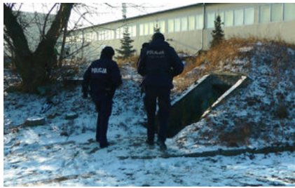
policjanci kontrolują miejsca przebywania osób bezdomnych #4