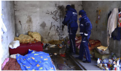
policjanci kontrolują miejsca przebywania osób bezdomnych #1