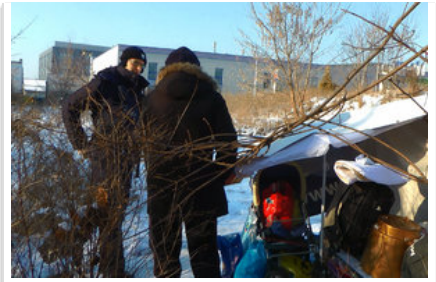
policjanci kontrolują miejsca przebywania osób bezdomnych #3